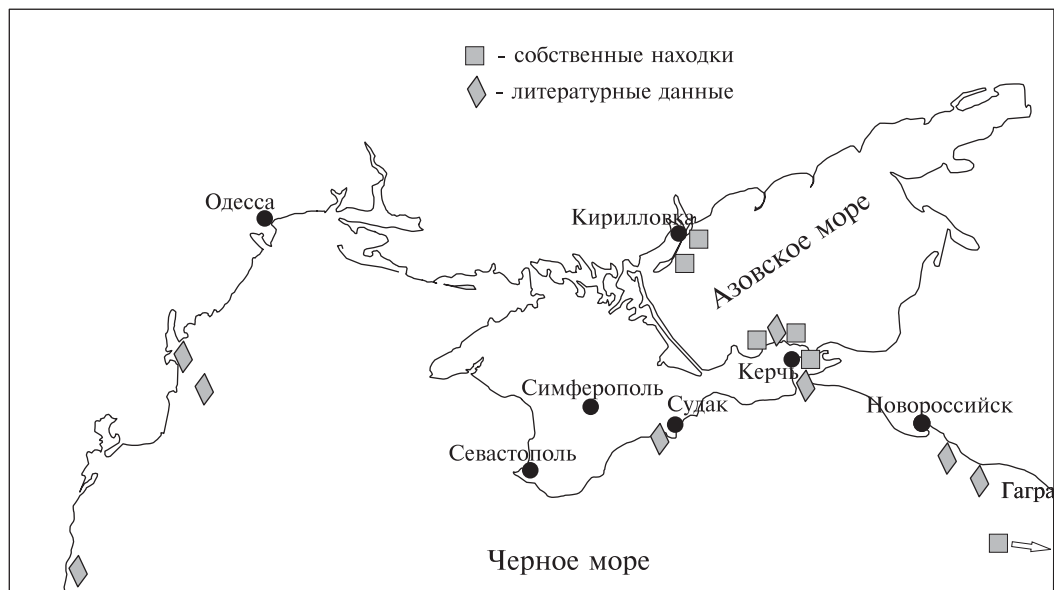
Рис. 2. Проникновение и расселение моллюска A. inaequalvis в Черном и Азовском морях.

Fig. 2. Penetration and colonizing of A. inaequalvis in the Black and Azov seas.